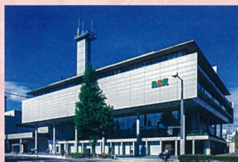
RSKインベティフ・メディアセンター

岡山市北区天神町9-24 (RSKインベティフ・メディアセンター 1F) TEL.086-221-1155